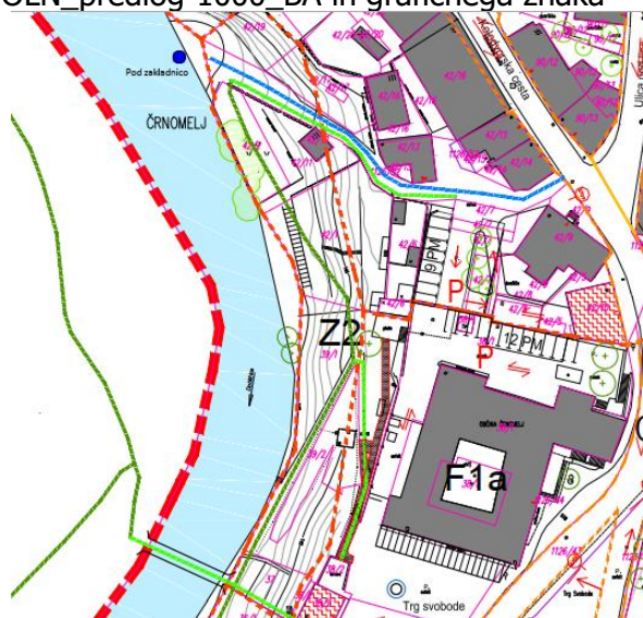
izrez iz karte 3a_1SD OLN_predlog-1000_BA

Pojasnjujemo, da je v osnutku in dosn SD OLN SMJ samo eno mesto pod Zakladnico določeno kot možno za pristan oz. kot vstopno/izstopno mesto, kot je razvidno iz izreza karte 3a_1SD OLN_predlog-1000_BA in grafičnega znaka – modra pika.