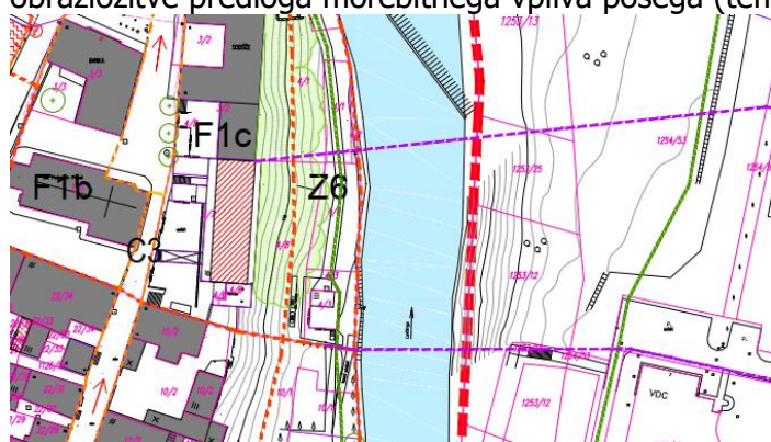
izrez iz karte 3a_1SD OLN_predlog-1000_BA

Odgovor: Pojasnjujemo, da tovrstni predlogi ZVN kot »pip« ne morejo biti zapisani, ker ne upoštevajo problema in konstrukcijskih možnosti ter povezave s ceno konstrukcijsko zahtevnega projekta premostitve in niso ne grafično utemeljeni in ne vsebujejo naravovarstvene obrazložitve predloga morebitnega vpliva posega (temelja) na NV.