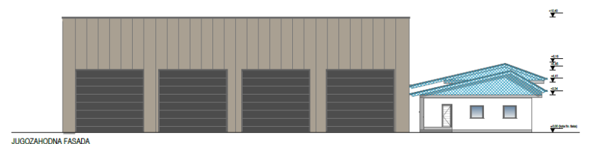
Predvideno novo stanje – jugozahodna fasada

Obstoječe stanje – jugozahodna fasada (DPP št. 13/2025, september 2025, ARHITEKTURA VRŠČAJ, Jure Vrščaj s.p.,