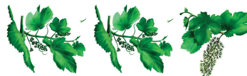
Začetek razvoja socvetij